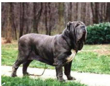
意大利那不勒斯犬