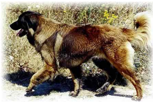
埃什特雷拉山地犬